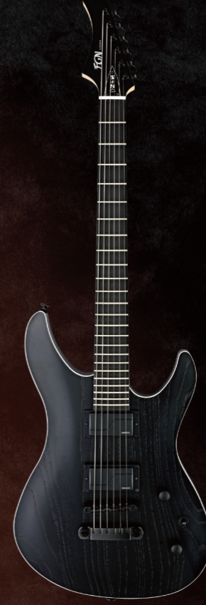
JMY2-ASH-E/OPB ¥139,000 (w/o tax)

Construction : Bolt-on Neck Body : Ash Neck : 5pc Maple/Walnut Asymmetrical Slim U-Shape Fingerboard : Ebony Fingerboard Radius : 350mmR Scale : 25.5" (648mm) Frets : 24F Jumbo C.F.S. Tuners : GOTOH® SG381-07 MG-T Bridge : FGN FJBR-STD Tailpiece : FGN FJTP-STD Hardware Color : Black Pickup (Neck) : FISHMAN® Fluence Modern Humbucker Alnico PRF-MHB-AB1 Pickup (Bridge) : FISHMAN® Fluence Modern Humbucker Ceramic PRF-MHB-CB1 Controls : 1Volume, 1Tone w/ Push-Pull SW (Voice Select), 3Way Toggle SW Body Finish : Open Pore Matte Strings : D'Addario EXL116 (.011-.052) Factory Tuning : Drop C (1D, 2A, 3F, 4C, 5G, 6C) Color : OPB, OPW