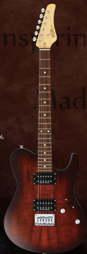
JIL2-EW1-G/IBS ¥128,000 (w/o tax)

Construction : Bolt-on Neck Body : Imbuia on Ash Neck : Maple U-Shape Fingerboard : Granadillo Fingerboard Radius : 250-350mmR (Compound) Scale : 25.5" (648mm) Frets : 22F Medium C.F.S. Tuners : GOTOH® SD91-05M MG Bridge : FGN FB-S05 Hardware Color : Chrome & Nickel Pickup (Neck) : Seymour Duncan® Jazz Neck SH-2n Pickup (Bridge) : Seymour Duncan® JB™ TB-4 Controls : 1Volume, 1Tone w/ Push-Pull SW (Coil Tap), 3Way Lever SW Body Finish : Gloss Strings : D'Addario EXL110 (.010-.046) Color : IBS