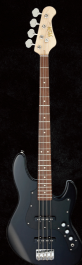
BMJ-G/BK ¥67,000 (w/o tax)