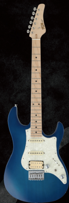
BOS2-M/TBS ¥67,000 (w/o tax)