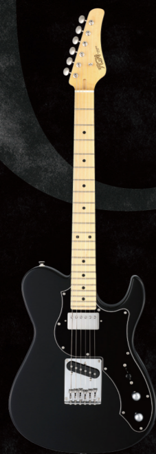
BIL2-M-HS/BK ¥67,000 (w/o tax)