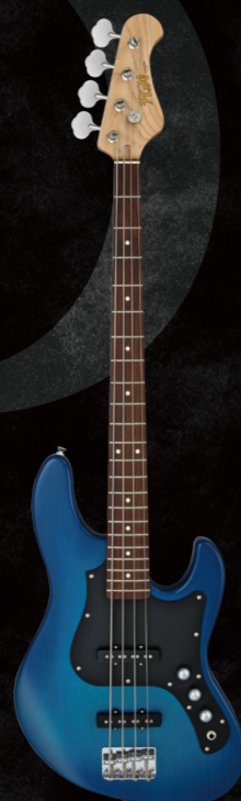
BMJ-G/TBS ¥67,000 (w/o tax)

Construction : Bolt-on Neck Body : Basswood Neck : Maple U-Shape Fingerboard : Granadillo Fingerboard Radius : 305mmR Scale : 34" (864mm) Frets : 22F Medium Jumbo C.F.S. Tuners : FGN FGGB600 Bridge : FGN FGOB-419 Hardware Color : Chrome & Nickel Pickup (Neck) : FGN JBD-1 Pickup (Bridge) : FGN JBD-2 Controls : 2Volume, 1Tone Body Finish : Gloss Strings : D'Addario EXL165 (.045-.105) Color : BK, TBS