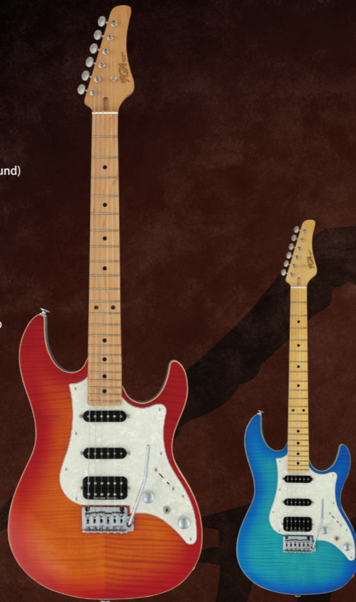
JOS2-FM-M/FBT ¥120,000 (w/o tax)

Construction : Bolt-on Neck Body : Flamed Maple on Basswood Neck : Maple U-Shape Fingerboard : Maple Fingerboard Radius : 250-350mmR (Compound) Scale : 25.5" (648mm) Frets : 22F Medium C.F.S. Tuners : GOTOH® SD91-05M Bridge : FGN FJTR-S2P Hardware Color : Chrome & Nickel Pickup (Neck) : Seymour Duncan® Alnicoll Pro APS-1 Pickup (Middle) : Seymour Duncan® Vintage Staggered SSL-1 rwrp Pickup (Bridge) : Seymour Duncan® Pegasus™-TB Controls : 1Volume, 1Tone, 5Way Lever SW, 1Mini SW (Coil Tap) Body Finish : Gloss Strings : D'Addario EXL110 (.010-.046) Color : FBT, OBT