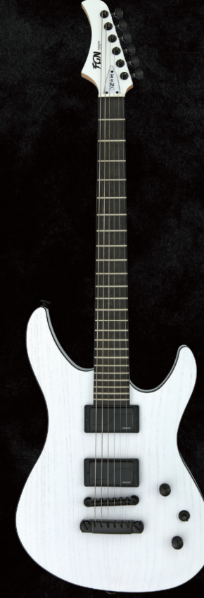
JMY2-ASH-E/OPW ¥139,000 (w/o tax)

Asymmetrical Slim U ネックシェイプ採用 FISHMAN® ピックアップ搭載 GOTOH® マグナム・ロック・トラッド・チューナー搭載