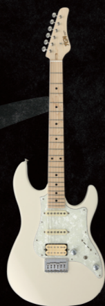
BOS2-M/AWH ¥67,000 (w/o tax)