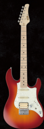
BOS2-M/CS ¥67,000 (w/o tax)