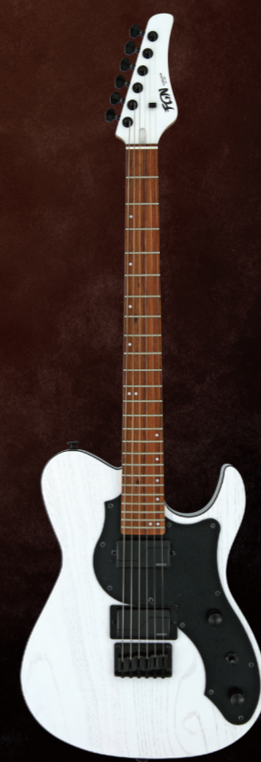
JIL2-ASH-DE664-G/OPW ¥128,000 (w/o tax)

Construction : Bolt-on Neck Body : Ash Neck : Maple U-Shape Fingerboard : Granadillo Fingerboard Radius : 250-350mmR (Compound) Scale : 26.14" (664mm) Frets : 24F Jumbo C.F.S. Tuners : GOTOH® SG381-07 MG-T Bridge : FGN FB-S05 Hardware Color : Black Pickup (Neck) : FISHMAN® Fluence Modern Humbucker Alnico PRF-MHB-AB1 Pickup (Bridge) : FISHMAN® Fluence Modern Humbucker Ceramic PRF-MHB-CB1 Controls : 1Volume, 1Tone w/ Push-Pull SW (Voice Select), 3Way Toggle SW Body Finish : Open Pore Matte Strings : D'Addario EXL116 (.011-.052) Factory Tuning : Drop C (1D, 2A, 3F, 4C, 5G, 6C) Color : OPB, OPW