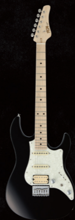
BOS2-M/BK ¥67,000 (w/o tax)