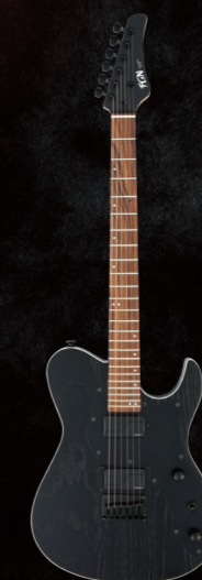
JIL2-ASH-DE664-G/OPB ¥128,000 (w/o tax)

664mm スケール採用 コンパウンド・ラディアス指板採用 FISHMAN® ピックアップ搭載 GOTOH® マグナム・ロック・トラッド・チューナー搭載