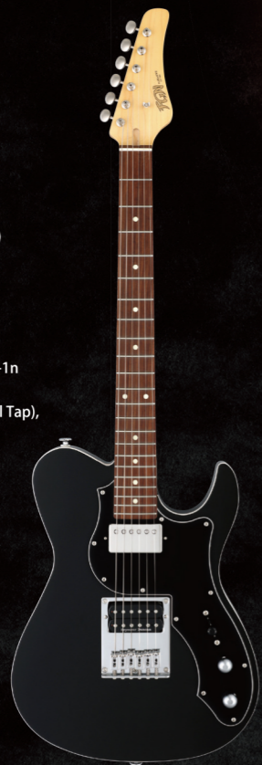
JIL2-AL-G-HH/BK ¥109,000 (w/o tax)

Construction : Bolt-on Neck Body : Alder Neck : Maple U-Shape Fingerboard : Granadillo Fingerboard Radius : 250-350mmR (Compound) Scale : 25.5" (648mm) Frets : 22F Medium C.F.S. Tuners : GOTOH® SD91-05M Bridge : FGN FJIL-6WSTD Hardware Color : Chrome & Nickel Pickup (Neck) : Seymour Duncan® '59™ Neck SH-1n Pickup (Bridge) : Seymour Duncan® JB™ TB-4 Controls : 1Volume, 1Tone w/ Push-Pull SW (Coil Tap), 3Way Lever SW Body Finish : Gloss Strings : D'Addario EXL110 (.010-.046) Color : BK