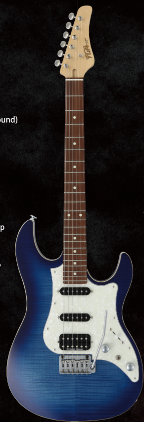
JOS2-FM-G/JBT ¥120,000 (w/o tax)

Construction : Bolt-on Neck Body : Flamed Maple on Basswood Neck : Maple U-Shape Fingerboard : Granadillo Fingerboard Radius : 250-350mmR (Compound) Scale : 25.5" (648mm) Frets : 22F Medium C.F.S. Tuners : GOTOH® SD91-05M Bridge : FGN FJTR-S2P Hardware Color : Chrome & Nickel Pickup (Neck) : Seymour Duncan® Alnicoll Pro APS-1 Pickup (Middle) : Seymour Duncan® Vintage Staggered SSL-1 rwrp Pickup (Bridge) : Seymour Duncan® Pegasus™-TB Controls : 1Volume, 1Tone, 5Way Lever SW, 1Mini SW (Coil Tap) Body Finish : Gloss Strings : D'Addario EXL110 (.010-.046) Color : JBT